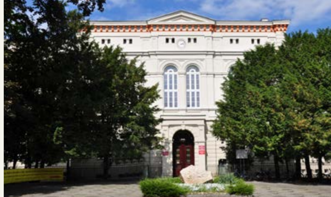
Zabytkowy gmach Liceum Ogólnokształcącego im. Marii Skłodowskiej-Curie