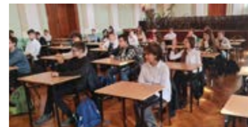
Bystrzak Językowy (marzec 2024)