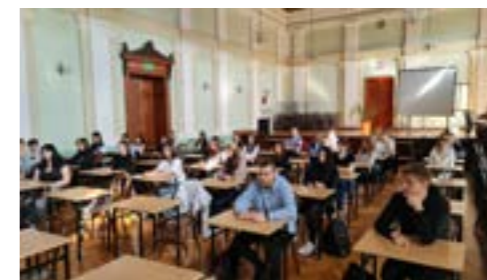
Strzeński Poliglota (kwiecień 2024)

Młodzi ludzie są najważniejsi! Wiedzą o tym nasi nauczyciele, dlatego organizują powiatowe konkursy przedmiotowe, które uzyskały wpis na listę konkursów organizowanych przez Dolnośląskiego Kuratora Oświaty. Laureaci i finaliści tych konkursów mogą otrzymać za swoje osiągnięcia dodatkowe punkty rekrutacyjne. Z pewnością słyszałeś o konkursie „Bystrzak Językowy” lub „Strzeński Geniusz Matematyczny”, o innych, których autorami są nasi nauczyciele. Sprawdź swoją wiedzę i weź udział w jednym z nich!