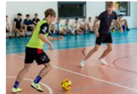
Zawody w piłkę nożną (luty 2025)