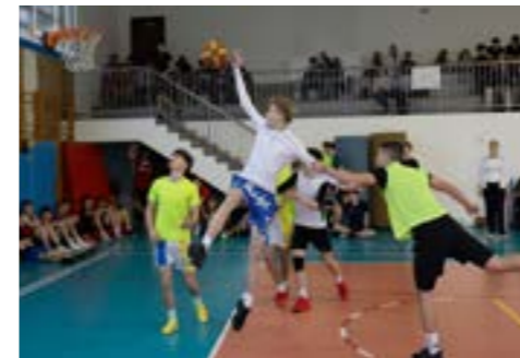
Zawody w koszykówkę 3x3 (styczeń 2025)

Mocną stroną naszej szkoły jest troska o kondycję i zdrowie uczniów, dlatego też organizujemy zawody sportowe, które cieszą się ogromną popularnością wśród młodzieży. Umiejętności gier drużynowych można doskonalić także na SKS - dodatkowych zajęciach sportowych dla dziewcząt i chłopców. O sportowych sukcesach licealistów oraz o zawodach sportowych znajdziesz wiele informacji na stronie internetowej szkoły www.lostrzelin.pl