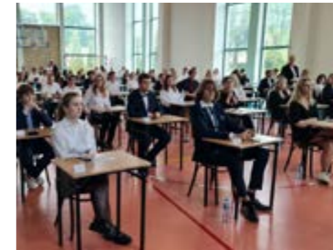
matura z języka polskiego (maj 2025)

Nasi absolwenci osiągają wysokie wyniki na egzaminie maturalnym. W naszej szkole dobrze przygotujesz się do matury na poziomie rozszerzonym, bo czeka na Ciebie nie tylko wykwalifikowana kadra, ale także bogata oferta edukacyjna,